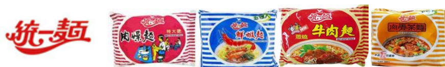
統一麵為獨家供應麵體單位

● 創意料理：以「統一麵系列」(統一麵有肉燥風味、蔥燒牛肉風味、肉骨茶風味、鮮蝦風味)為主食材，由參賽者選擇一款「泡麵結合自選食材」自由創作出一道創意料理(自選食材不拘)。保證統一麵為獨家供應麵體單位即可