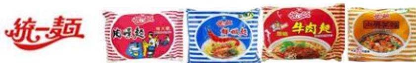
統一麵為獨家供應麵體單位